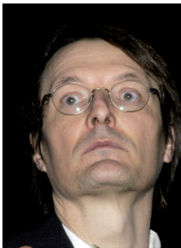
Karl Lauterbach, SPD-Gesundheitspolitiker

Acht Jahre Demontage des besten Gesundheitssystems der Welt. Acht Jahre Politik für Klinikkonzerne, gegen freie Arztpraxen.